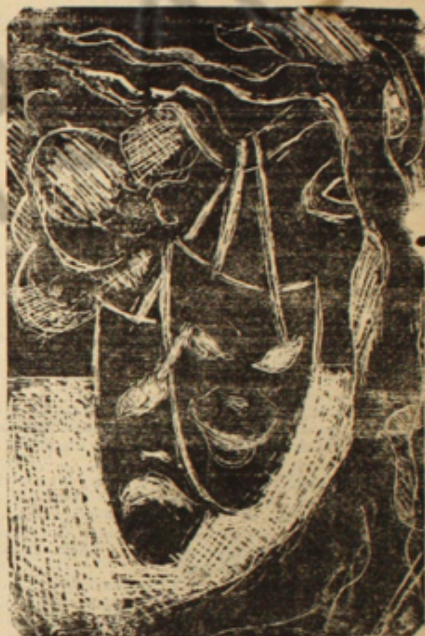
Ilustração de capa dos programas do Teatro de Câmara do C. A. M. -- realização de Moacir Fernandes

O Circulo de Arte Moderna realizou, a sete de maio, a segunda récita do seu teatro de Câmara.