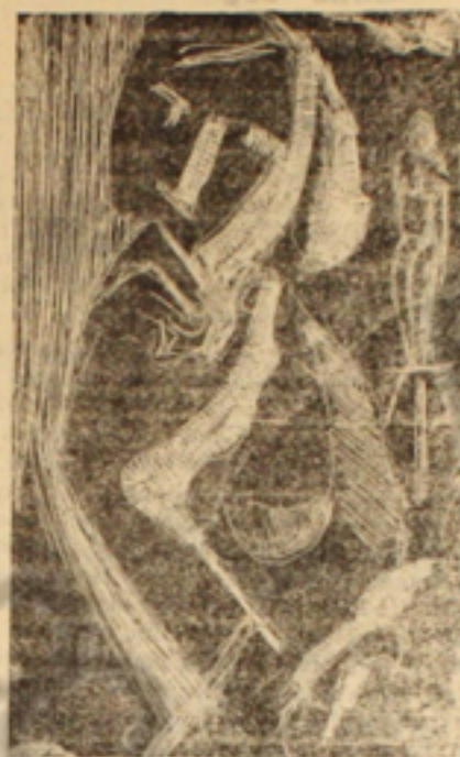
Ilustração de MOACIR FERNANDES

mãos desconfiadas, uma à frente outra atrás, parecendo esquivarem-se; o paletó com o botão na casa errada, atraíam olhares furtivos, olhares críticos, intronitados e observadores. As mãos estão sofrendo o martírio do desentendimento. Velhas amizades, jogadas pelo destino ao fracasso inevitável. Numa convivência de 30 anos, trabalhando juntas, lavando-se mutuamente, modelando, vivendo, enfim todas as alegrias e todos os desgostos, não era possível a existência da dúvida e da prevenção. Elas se levam, empalmam-se para o céu e dois olhos vidrados, cheios de angústia, penetram-lhes a carne. Mais rápido que o movimento de um passo, juntam-se nervosas aflitas e desoladas e suarentas. Suor frio. Suor de morte.