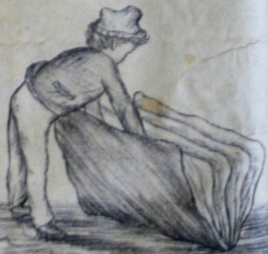
Tencionavamos mostrar aos leitores alguma coisa bre o mar de Maria, mas... fica para outra vez.