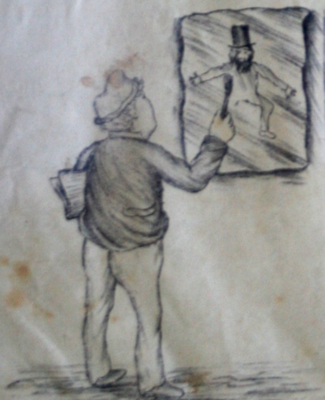
Nós também sentimos a ida de s. exa. por- que nunca mais o poderemos ver.